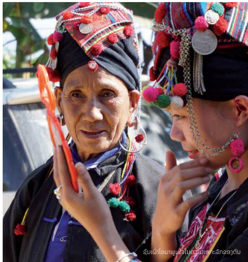
ຊົນເຜົ່າໂອມາພູມໃຈໃນຄວາມເອກະລັກຂອງຕົນ

ຊາວໂອມາເປັນພຽງໜຶ່ງໃນ 50 ຊົນເຜົ່າຂອງລາວທີ່ ໄດ້ຮັບການຍອມຮັບຢ່າງເປັນທາງການ, ໂດຍແຕ່ລະ ກຸ່ມຊົນເຜົ່າລ້ວນແຕ່ມີເລື່ອງລາວທີ່ເລົ່າຂານຢ່າງໜ້າ ສົນໃຈ. ຖ້າທ່ານມີຄວາມຕ້ອງການຢາກສຶກສາສຳຫຼວດ ຄວາມຫຼາກຫຼາຍທາງວັດທະນະທຳອັນອຸດົມສົມບູນຂອງ ປະເທດລາວ, ທ່ານສາມາດເຂົ້າທ່ຽວຊົມໄດ້ທີ່ສູນສິລະ ປະພື້ນເມືອງ ແລະ ຊົນເຜົ່າ ແຂວງຫຼວງພະບາງ.