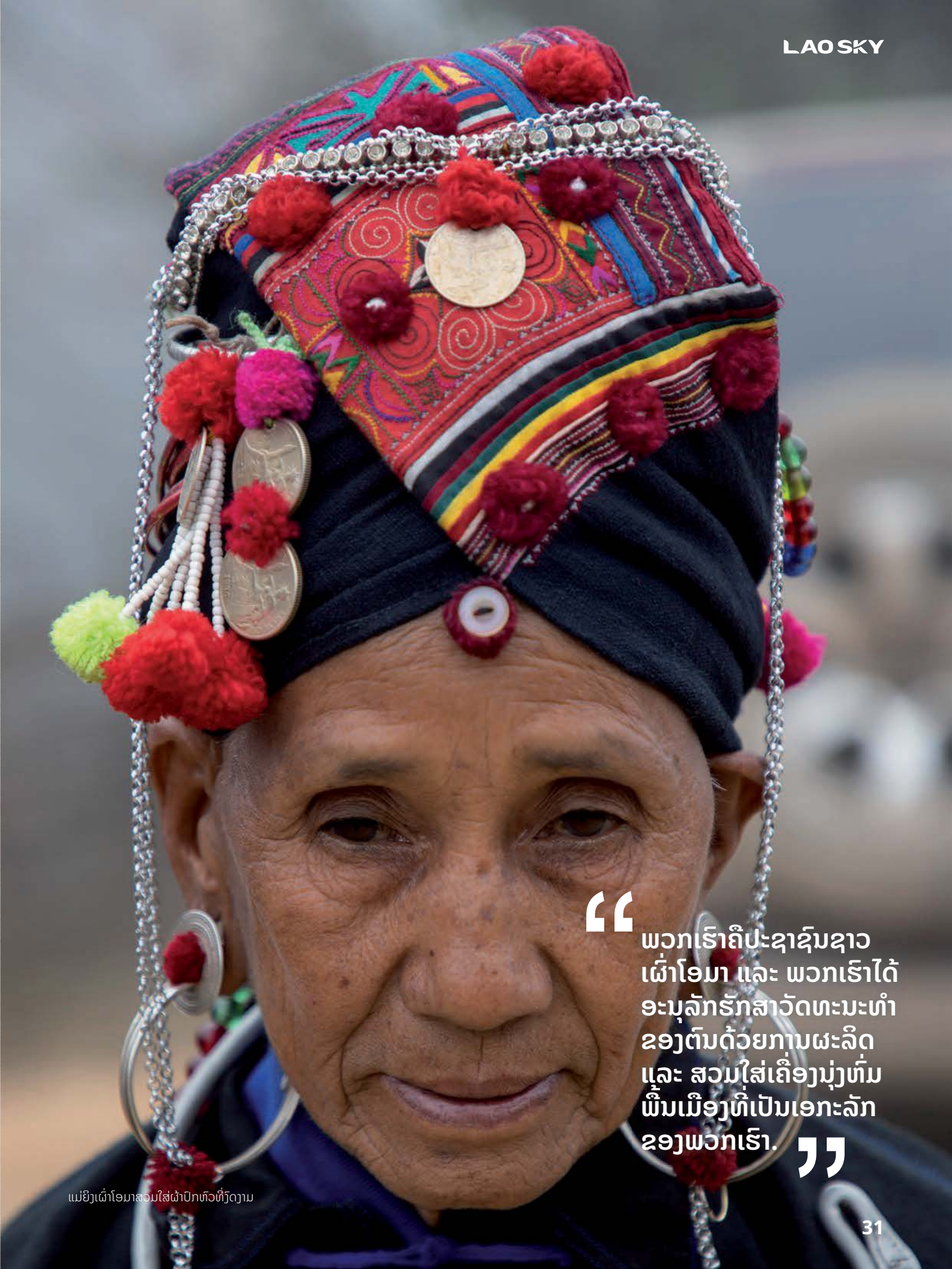
ແມ່ຍິງເຜົ່າໂອມາສວມໃສ່ຜ້າປົກຫົວທີ່ງົດງາມ

“ ພວກເຮົາຄືປະຊາຊົນຊາວເຜົ່າໂອມາ ແລະ ພວກເຮົາໄດ້ອະນຸລັກຮັກສາວັດທະນະທຳຂອງຕົນດ້ວຍການຜະລິດ ແລະ ສວມໃສ່ເຄື່ອງນຸ່ງຫົ່ມພື້ນເມືອງທີ່ເປັນເອກະລັກຂອງພວກເຮົາ. ”