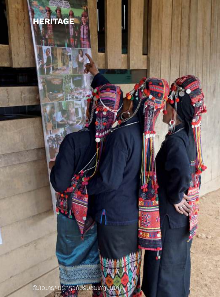
ຄົນໂອມາຮຽນຮູ້ກ່ຽວກັບຊັບສິນທາງປັນຍາ

ຂອງຕົນເອງ. ວຽກງານດັ່ງກ່າວ ໄດ້ເຮັດໃຫ້ TAEC ມີການເຊື່ອມ ໂຍງກັບພາກສ່ວນອື່ນໆເພື່ອຊ່ວຍແກ້ໄຂປັນຫາດຽວກັນນີ້ ແລະ ການສວຍໂອກາດທາງວັດທະນະທຳທີ່ແຜ່ກະຈາຍໄປທົ່ວໂລກກໍປາ ກົດແຈ້ງແບບຊັດເຈນຂຶ້ນ. ງານວາງສະແດງ ພາຍໃຕ້ຫົວຂໍ້ “ການຟື້ນ ຟູສິດທິ” ທີ່ໄດ້ວາງສະແດງຜົນງານປະດິດຂອງບັນດາຊາວຊ່າງຫັດ ຖະກຳທີ່ໜ້າອັດສະຈັນ ຈາກແມັກຊິໂກ, ຟີລິບປິນ, ເຄນຍາ ແລະ ໂຣ ມາເນຍ, ເຊິ່ງທັງໝົດນີ້ຖືກນຳມາໃຊ້ເປັນ “ແຮງບັນດານໃຈ” ໂດຍນັກ ອອກແບບແຟຊັ້ນລະດັບໄຮເອນດ໌. ງານວາງສະແດງດັ່ງກ່າວ ຖືເປັນ ເວທີທີ່ດຶງດູດເອົາຄວາມສົນໃຈຈາກສັງຄົມໃນທົ່ວໂລກ ໃນການຕໍ່ ຕ້ານການສະແຫວງຫາຜົນປະໂຫຍດຈາກເອກະລັກທາງວັດທະນະ ທຳຂອງພວກຕົນ.