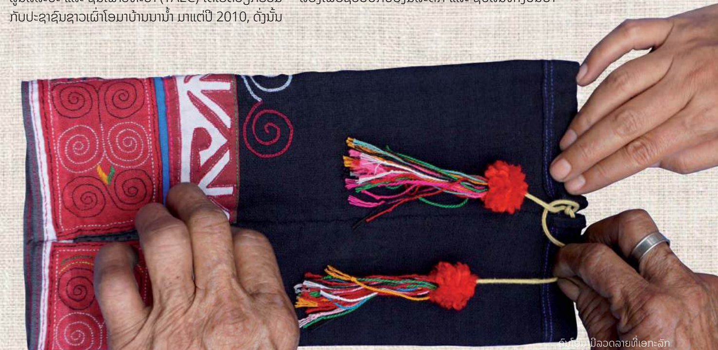
ຈົນຕິມິນີລວດລາຍທີ່ເອກະລັກ

TAEC ຈຶ່ງໄດ້ຮ່ວມມືກັບຊາວເຜົ່າໂອມາ ໃນການສ້າງແບບຈຳລອງເພື່ອຊ່ວຍປົກປ້ອງມໍລະດົກ ແລະ ຊັບສິນທາງປັນຍາ